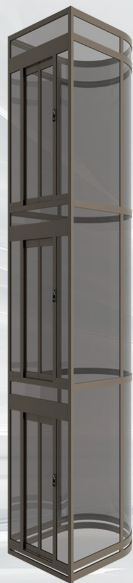
2000M系列 半圆形观光电梯