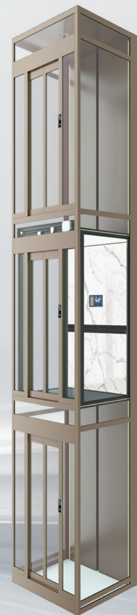
3000-3 三力平衡式观光电梯(有轿门)