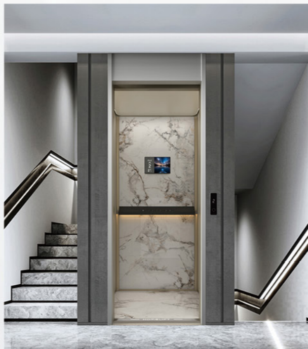
1000系列 非观光井道电梯