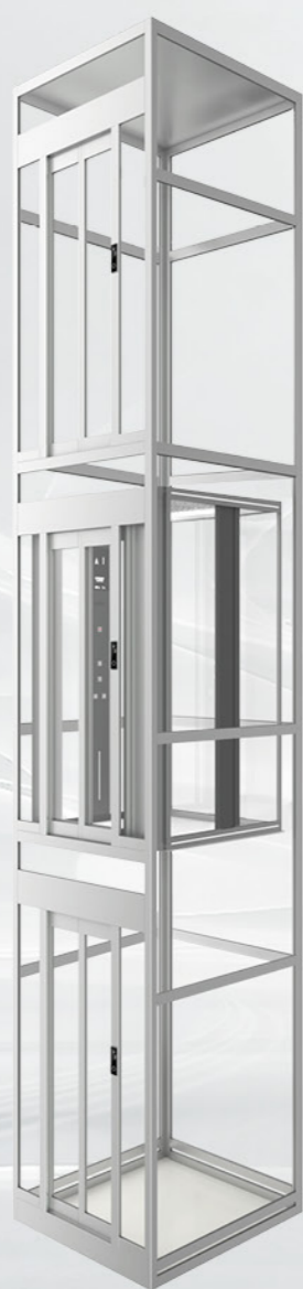
2000系列 大井道龙门架观光电梯