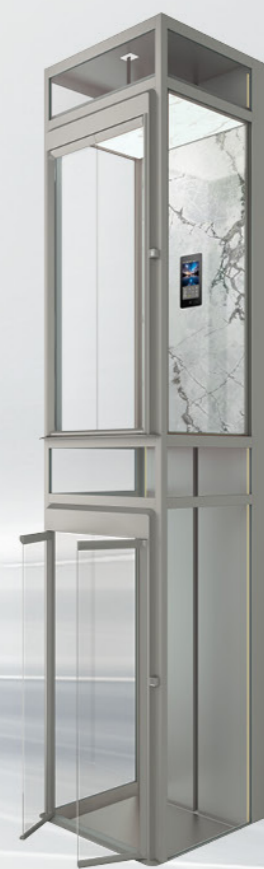
3000-2 三力平衡式轿厢平台