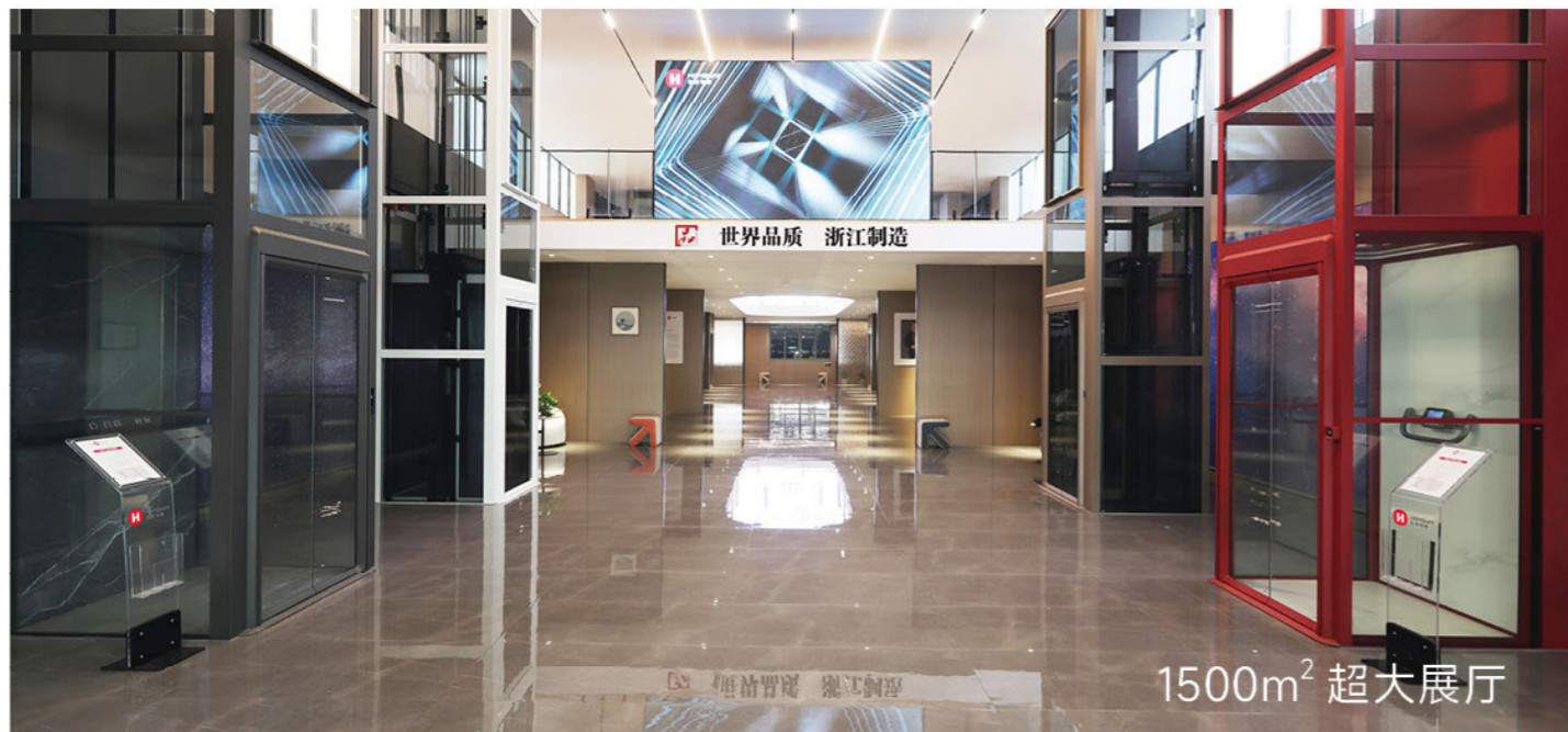
1500m 2 超大展厅

弘威电梯是一家专注家用电梯的轻奢品牌，建立了 全场景、全尺寸 的家用电梯产品体系，尤其在 小井道定制 和 观光电梯高定 领域具备强大的技术实力和服务能力。