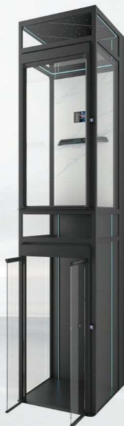
5000M系列 轿厢平台(复式楼专用)